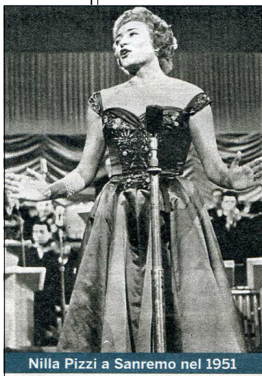
Nilla Pizzi a Sanremo nel 1951

Mio padre mi racconta che una notte si sentono delle grida, e il rumore di camion, si sentono dei colpi sulla strada, e canta-