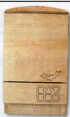
La Box Bat a Marzo nei supermercati Coop ....